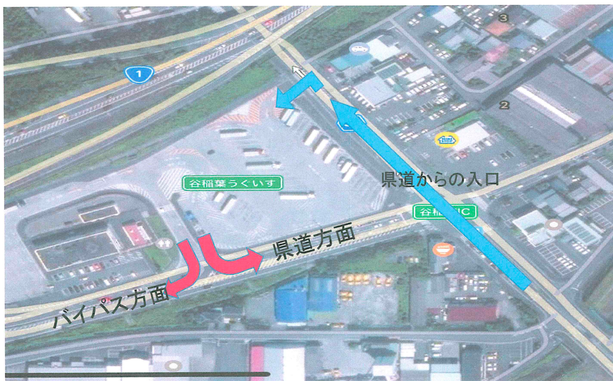
谷稲葉ICうぐいすパーキング県道からの入り方(大型バス・マイクロバス)